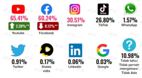
Gambar 1 Media Sosial yang Sering Digunakan

Adapun data mengenai media sosial yang sering digunakan masyarakat Indonesia, menurut survei APJII berdasarkan peringkat yaitu Youtube dengan persentase 65,41%; Facebook dengan persentase 60,24%; Instagram dengan persentase 30,51%; Tiktok dengan persentase 26,80%; WhatsApp dengan persentase 1,57%; Twitter dengan persentase 0,91%; Snakevidio dengan persentase 0,17%; LinkedIn dengan 0,06%; serta jawaban tidak tahu dengan 10,98%. 38 Agar lebih mudah, akan ditampilkan dalam gambar di bawah ini: